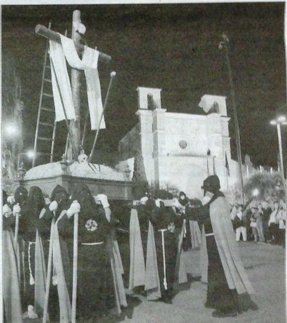
La Cruz Desnuda de Jerusalén saldrá por segundo año con 12 banceros. N.A.

nera, los 24 banceros que portan el Santo Sepulcro y los 12 de la Cruz Desnuda -este será el segundo año consecutivo que saldrán- llevan más de un mes preparando el desfile procesional del Viernes Santo. Lo hacen los martes, desde las 20.30 horas, en la nave guardapasos de la Junta de Cofradías y Hermandades. El último ensayo será en la tarde del Domingo de Ramos, en la concatedral de Santa María.